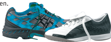
Joggingschuh / Universal-Hallen-Sportschuh

Man sollte sich beim Kauf also gut beraten lassen und die Möglichkeit nutzen, qualitativ hochwertige Auslaufmodelle preisgünstig zu erwerben.